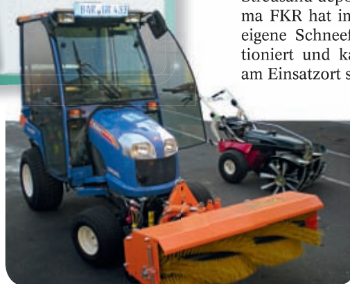
Die neuen Schneefahrzeuge

Wie im letzten Heft vorgestellt und angekündigt, befassen wir uns mit Themen aus der Zufriedenheitsbefragung, die für Sie wichtig sind. Ein Thema war der Winterdienst und wie der Volksmund sagt, sind gute Vorbereitungen die halbe Miete ... Nach der vorigen Schneesaison hat die Genossenschaft in die Vorbereitung viel Zeit investiert. Alle Verträge und Pläne wurden gründlich geprüft. Die beiden Firmen, die bereits langjährig tätige FKR GmbH und die neu für die Genossenschaft arbeitende Firma Arcus, wurden noch einmal detailliert eingewiesen. Die Hausverwaltung hat sich von den organisatorischen Vorbereitungen und vom modernen Fuhrpark überzeugt. In allen Wohngebieten wurde ausreichend Streusand deponiert. Die Firma FKR hat im Heineviertel eigene Schneefahrzeuge stationiert und kann so gleich am Einsatzort starten.